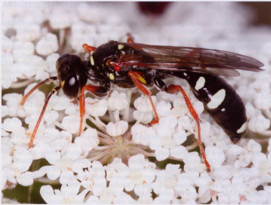
Abb. 37: Weibchen der Grabwespe Mellinus crabroneus . Die in Hessen stark rückläufige Art trägt zur Larvennahrung Fliegen ein. Gründe für den Rückgang der ehemals in Hessen weit verbreiteten und scheinbar ehemals nicht seltenen Art sind unbekannt. Foto: Rutkies, Juli 2008, Osnabrück.