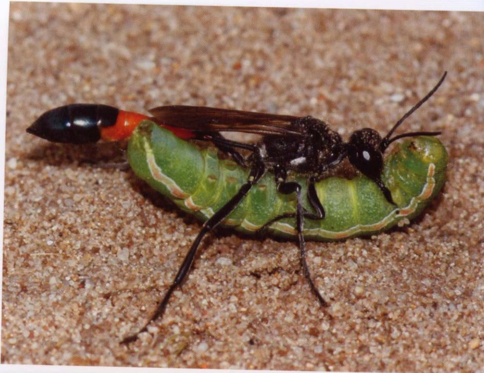
Abb. 22: Weibchen der Grabwespe Ammophila sabulosa mit einer erbeuteten Eulenraupe ( Panolis flammea ). Die Grabwespe besiedelt trockene Lebensräume, ist im gesamten Bundesland weit verbreitet und kommt auch im Siedlungsbereich vor. Sie gehört daher zu den häufigsten Grabwespenarten in Hessen. Zur Larvennahrung trägt sie ausschließlich Schmetterlingsraupen ein, die sie lähmt und in ihr Nest im Boden transportiert. Foto: Rutkies, 2008, Osnabrück.